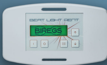
Devant (en activité)